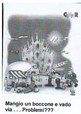
Mangio un boccone e vado via... Problemi???