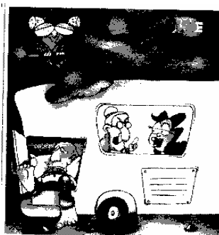
E non guardarmi così... non è colpa mia se tuo marito russa!